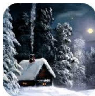
Oben: Christmas Radio Rechts: Weihnachts-Countdown 2018

Die App Christmas Radio sorgt schnell für die richtige Weihnachtsstimmung. Ob man mit oder ohne Kerzenlicht, alleine und in Ruhe den Abend ausklingen lassen möchte, oder noch schön zusammensitzt und für weihnachtliche Atmosphäre sorgen will, mit Christmas Radio ist für all das gesorgt.