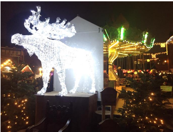
Weihnachtsmarkt in der Kulturbrauerei

Genießen Sie die Adventsstimmung mit einem Bummel über einen Weihnachtsmarkt und vergessen Sie den Shoppingstress für einige Zeit.