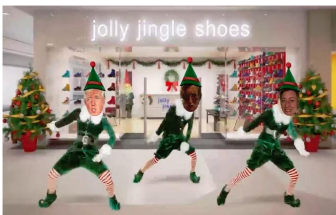
Tanzvideo aus der App ElfYourself

ElfYourself ist ein gelungener Weihnachtsspaß. Passend zu den letzten Tagen vor dem Fest, ist das genau die richtige App für jeden heimlichen Elfen. Zum richtigen Zeitpunkt verschickt, sorgt die elfische Tanzbotschaft mit Sicherheit für große Lacher. Und so funktioniert's: Die App verpackt ein Foto (muss nicht das eigene sein) in ein Elfenkostüm, was schon aberwitzig aussieht, erstellt ein kurzes Tanzvideo zu weihnachtlicher Musik - und fertig ist die perfekte Weihnachtsgrußkarte!